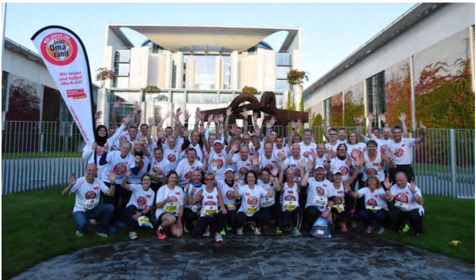
Gruppenfoto vor dem Bundeskanzleramt von einem Großteil der Jede Oma zählt-Sportler.