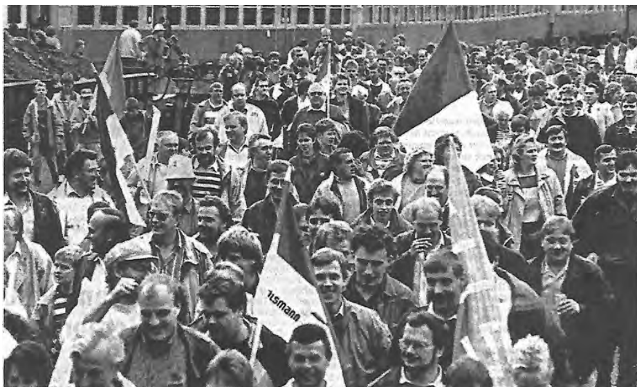
Ankunft des Sonderzuges aus Bersenbrück auf dem Groß Ilseder Bahnhof: Erwartungsfroh waren die Schlachtenbummler gestimmt, letztlich hatte sich ihre Reise nach Olsburg gelohnt.