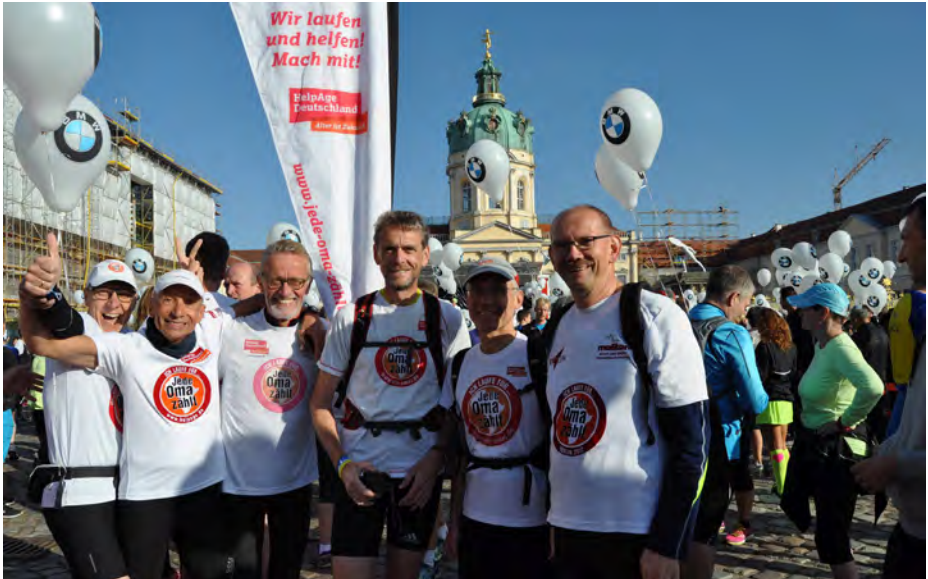
Oma-Läufer vor dem Schloss Charlottenburg beim Start zum Frühstückslauf am Samstag.