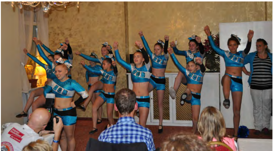
Eine Kostprobe der „Oma“ Cheerleader vom Club TSV Wittenau gab es beim Pastaabend.